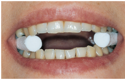
Abb. 2: Mit Watterollen Nr. 1 zwischen den Seitenzähnen geht der Patient eine Minute

und lassen den Patienten eine Minute eine gerade Strecke durch die Praxis gehen (Abb. 2). Wenn das Becken danach nicht mehr schief steht, liegt die Ursache am Kiefergelenk und/oder an der Okklusion. Die häufigste Störung ist eine Infraokklusion auf einer Seite, 40 \mu reichen schon, um einen Beckenschiefstand und damit Rückenschmerzen auszulösen.