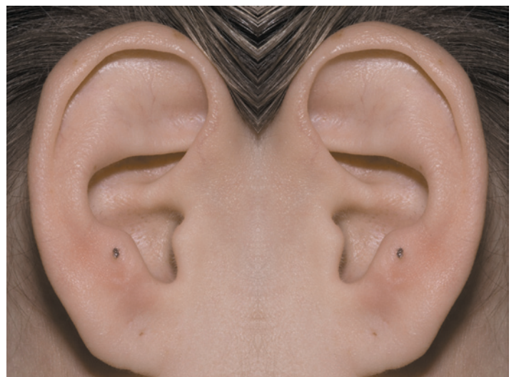
Abb. 4: Akupunktur nach Gumbiller

Bei starken Verspannungen und Schmerzen der Kau- und Rückenmuskulatur behandeln wir unsere Patienten zusätzlich mit einem Tens-Gerät (Tenstem dental, Fa. Schwa-medico) und können auch zur Entspannung des Bewegungsapparates mit den Ohrhaltern auf die Akupunkturpunkte am Antitragus gehen, um das Becken wieder gerade zu stellen [20]. Das kann auch