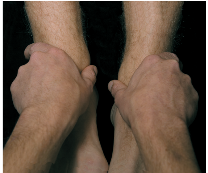
Abb. 3: Das linke Bein schiebt 10 mm vor

Anschließend schicken wir den Patienten erst zum Physiotherapeuten und anschließend zum Osteopathen. Die Schiene trägt der Patient nur beim Schlafen und setzt sie eine halbe