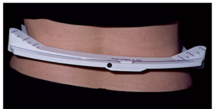
Abb. 1: Das Becken ist links 10 mm höher

Bevor wir dem Patienten in den Mund schauen, lassen wir ihn die Schuhe ausziehen und messen mit unseren Händen oder einer Beckenwaage (Abb. 1), ob ein Beckenschiefstand vorliegt. Dann führen wir den Meerssemann-Test durch: wir legen 2 kleine Nr.1 Watterollen auf die Seitenzähne